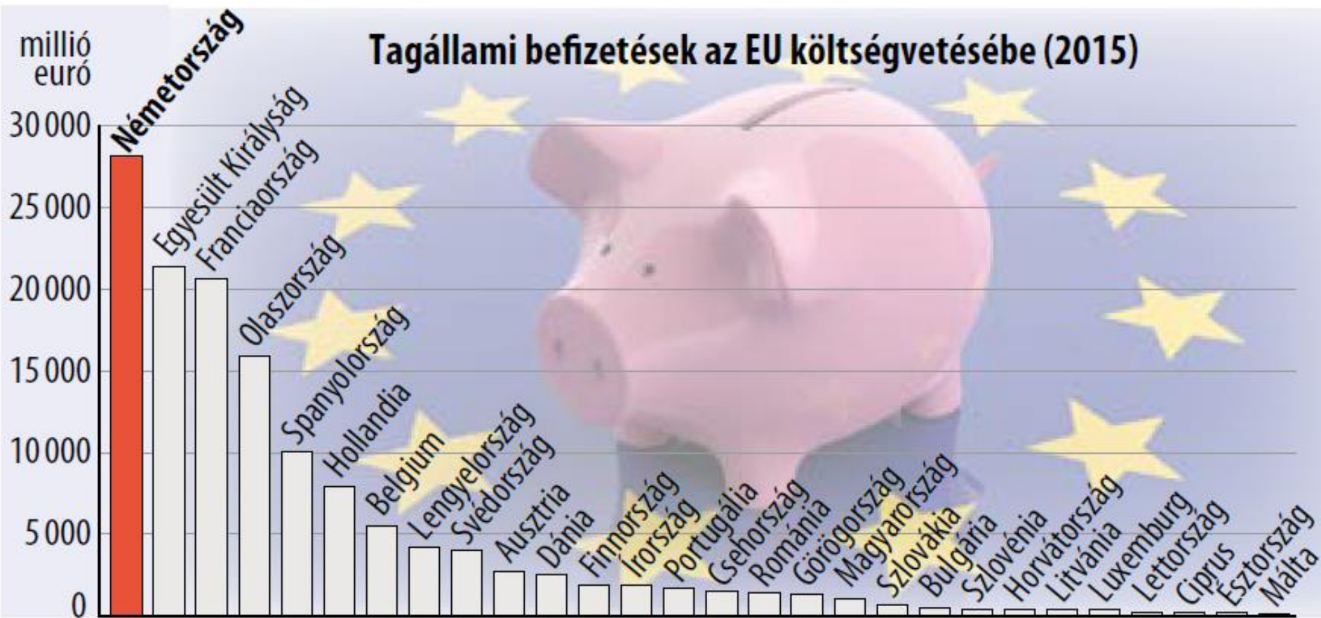
6.1. Tagállami befizetések az EU költségvetésébe (2015)